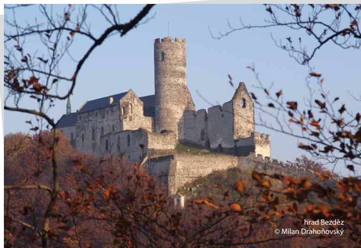
hrad Bezděz

Pod hrad i k Máchovu jezeru se dostanete vlakem, kterým pohodlně přepravíte i svá kola, nebo autobusem. Zbytek již zvládnete po turistických trasách a cykloznačení.