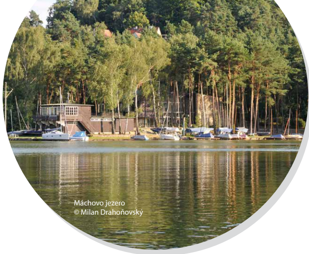
Máchovo jezero © Milan Drahoňovský