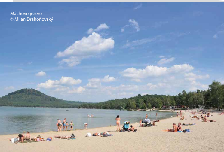
Máchovo jezero