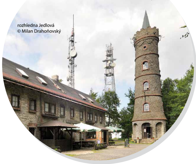
rozhledna Jedlová