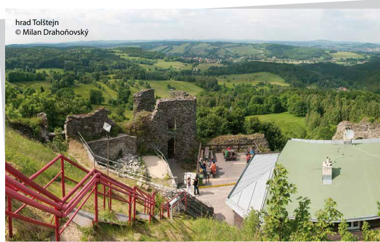
hrad Tolštejn

Příjemnou procházkou se z vrcholu Jedlové dostanete k romantické středověké zřícenině hradu Tolštejn. Hrad byl pravděpodobně postaven Vartenberky ve 2. polovině 13. století k ochraně Pražské cesty – významné obchodní cesty spojující vnitrozemí Čech s Lužicí. Zřícenina hradu také kdysi bývala sídlem místních loupeživých rytířů. V současnosti je památka volně přístupná. V areálu se nachází placená skalní vyhlídka, umožňující pohled na území Čech a Saska.