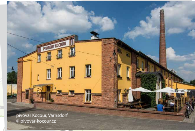
pivovar Kocour, Varnsdorf

Ve Varnsdorfu se mimo jiné nachází (mini)pivovar Kocour, jenž byl založen v roce 2007 a nabízí pestrou paletu pivních speciálů. V areálu pivovaru naleznete restauraci s terasou, sportovní zářezí nebo pivovarskou ZOO. Rozmanitá je také nabídka ubytování.