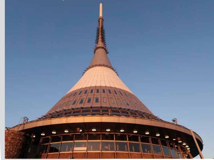
Vysílač a hotel Ještěd © Karel Hubáček – dědicové 1963

Na Ještědském hřebenu je také skiareál, snadno dostupný z města.