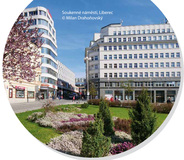
Soukenné náměstí, Liberec