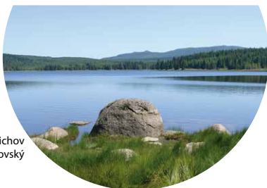
vodní nádrž Bedřichov

Z Liberce, autobusového nádraží a terminálu Fügnerova jedou na Bedřichov také sezónní regionální autobusy. Přehled na www.iidol.cz .