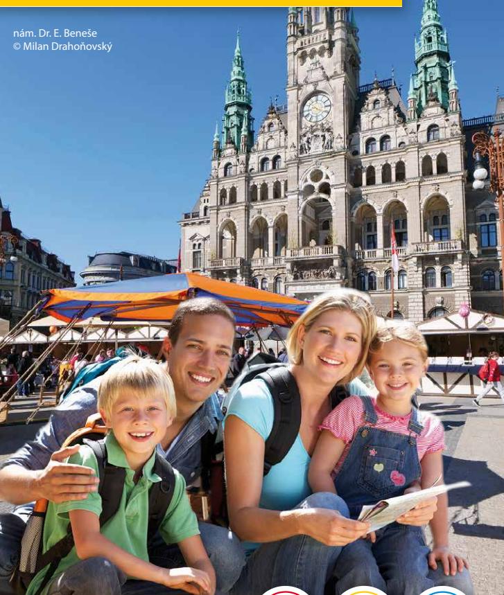
nám. Dr. E. Beneše