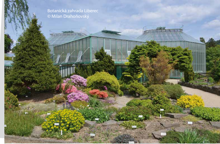
Botanická zahrada Liberec