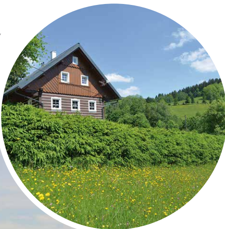
Rokytnice nad Jizerou, 2x © Milan Drahoňovský