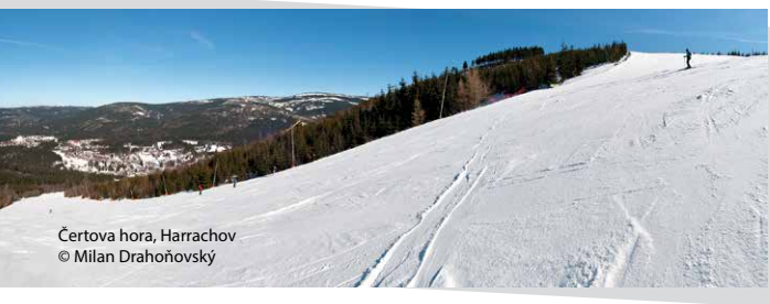
Čertova hora, Harrachov

Nejčastěji navštěvovanou atrakcí, vzdálenou asi 2 km od města, je Mumlavský vodopád. Návštěvníkům Harrachova je k dispozici dále bobová dráha, přírodní lanový park MonkeyPark a v létě lze využít Krkonošské cyklobusy.