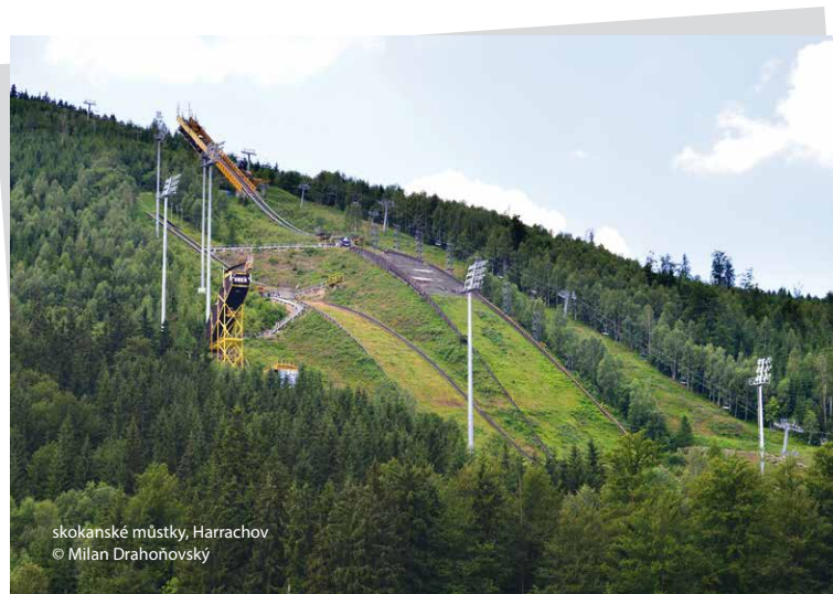
skokanské můstky, Harrachov

U spodní stanice lanové dráhy je dětský park s velkým dřevěným hradem, trampolínou a nafukovacím skákacím hradem.