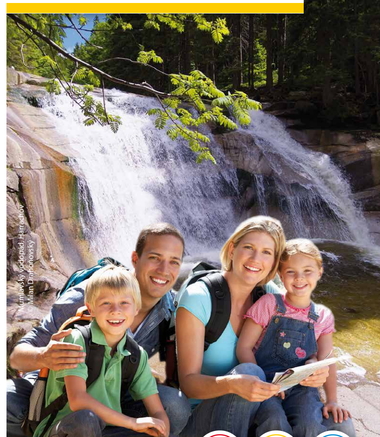
Mumlavský vodopád, Harrachov Milan Drahoňovský