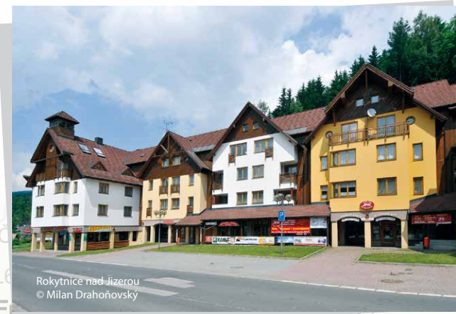
Rokytnice nad Jizerou

Horské letovisko se nachází mezi masivy hor Stráž, Čertova hora a Lysá hora. Je zde několik skiareálů se sjezdovými tratěmi i běžecké trasy. Sjezd z Lysé hory z výšky 1 315 m n. m. patří k jednomu z nejdelších v ČR. Ve skiareálu Horní Domky je od roku 2017 v provozu bikepark . Je zde také lanový park.