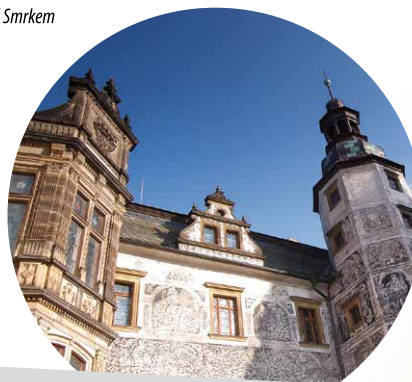
hrad a zámek Frýdlant