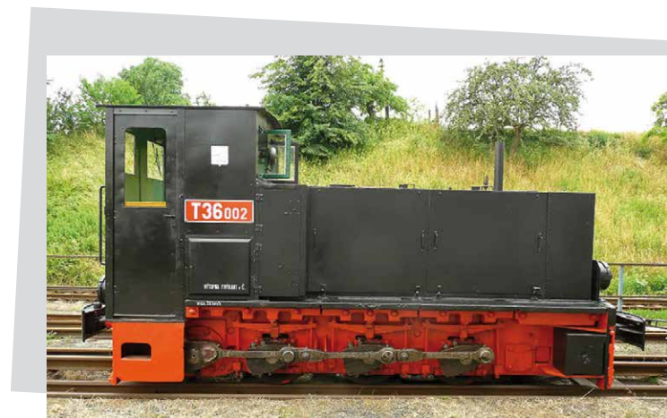
muzeum Heřmanička, Frýdlant