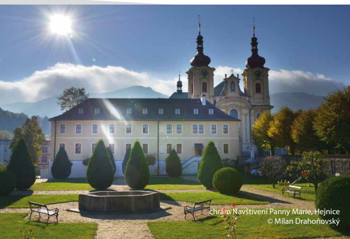
chrám Navštívení Panny Marie, Hejnice

V Hejnicích lze vedle chrámové dominanty navštívit Muzeum horolezectví , projít se do nedalekých Lázní Libverda , občerstvit se v restauraci Obří sud či navštívit arboretum ve Ferdinandově.