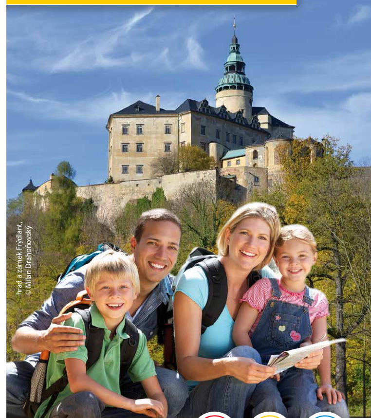
hrad a zámek Frýdlant, © Milan Drahoňovský