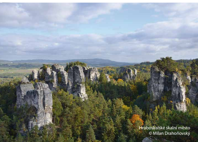
Hruboskalské skalní město

Při poznávání Hruboskalska můžete navštívit několik míst, kde se natáčely známé české filmy a pohádky. Skalní město je též vyhledávanějším místem horolezců.