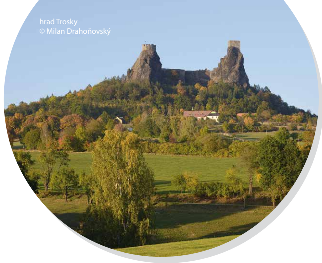
hrad Trosky