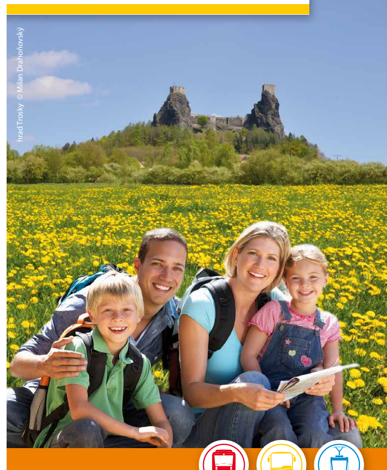
hrad Trojský