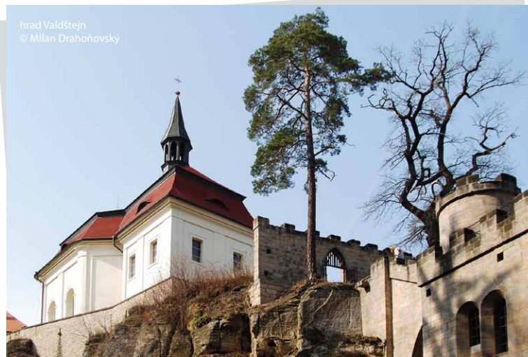
hrad Valdštejn

Při úpravách v 19. století byla na konci hradu vybudována vyhlídka na Trosky a blízké skalní město. Krásné výhledy na okolní krajinu se nabízejí i z dalších míst hradu.