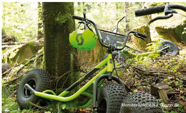
Monster koloběžka

Poklidné město Neukirch v Horní Lužici je známé i svými tradičními výrobky jako suchary Neukircher Zwieback a četnými ručně vyráběnými produkty z místních hrncířských dílen.