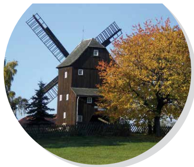
větrný mlýn Berndt Mühle, Oderwitz