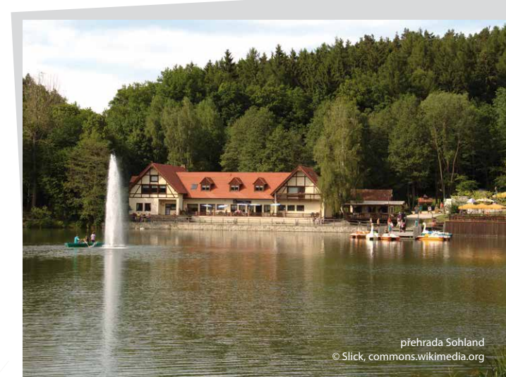
přehrada Sohland