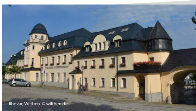
lihovar, Wilthen

Pro pěší turisty je ve Wilthenu a jeho okolí připravena značená trasa Po stopách Pumphuta o celkové délce 17 km. Martin Pumphut je legendární postava z Horní Lužice – mlynářský chlapec se špičatým kloboukem a magickými schopnostmi. To mu vyneslo přezdívku „čaroděj Horní Lužice“. Pumphut je také symbolem Wilthenu a stojí zde jeho velká dřevěná socha.