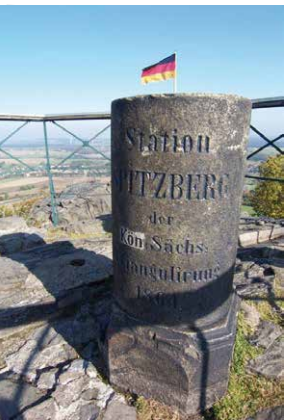
vrchol hory Spitzberg, Oderwitz

Obec Oderwitz patří díky výborné krajinné poloze a mnoha pěkně renovovanými podstávkovými domy k nejkrásnějším vesnicím v Horní Lužici. K tomu je Oderwitz jediným místem v celém Německu, kde se nacházejí hned tři restaurované větrné mlýny německého typu.