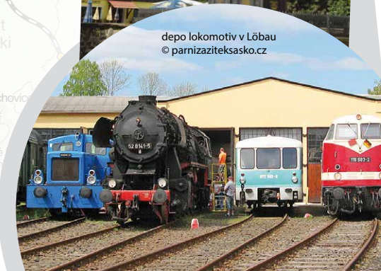
depo lokomotiv v Löbau