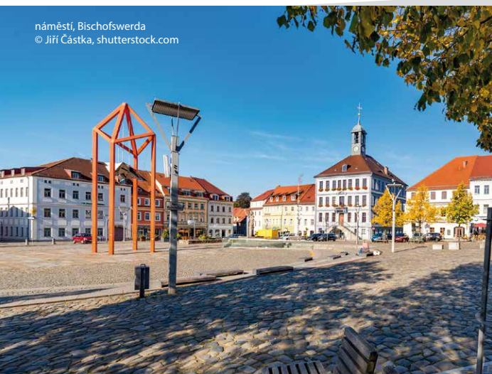
náměstí, Bischofswerda

Oblast kolem Bischofswerdy charakterizují nádherné hrady, tradiční řemesla a Hornolužická pahorkatina, která je ideální pro turisty a cyklisty. Nedaleko města Bischofswerda se nachází barokní zámek Rammenau, Labské pískovce se známým skalním mostem Bastei, pevností Königstein a malebným lázeňským městečkem Bad Schandau. Snadno dostupné je i zemské hlavní město Dresden a historické město Bautzen.